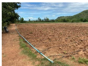
พื้นที่เกษตรกรรมใกล้เคียง (ไร่อ้อย, มันสำปะหลัง)