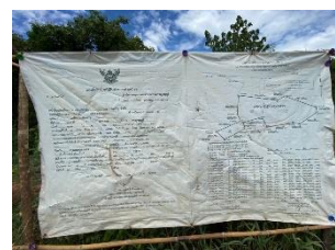
ป้ายแสดงรายละเอียดโครงการ