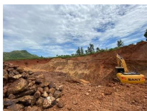
พื้นที่หน้าเหมืองปัจจุบัน (บริเวณพื้นที่ บริษัท พร็อพเพอร์ตี้ โปรเซส จำกัด รับช่วงการทำเหมือง)